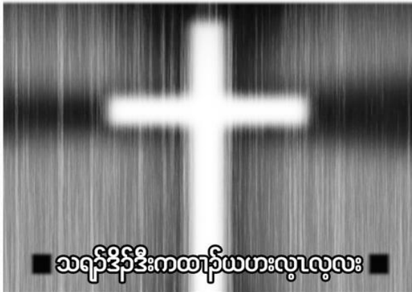
■ သရ်ဒိန်ဒီးကထာ်ယဟးလွၤလွၤလး ■

ယွၤအဘျးအဖိုင်အပိ ပလဲၤခိဖျိဘန်ဆူ နံၣ်တတ်လံန့ၣ်လီၤ. ပစံးဘျးဘန်ကစၢ်ယွၤ လၢအဆုၤ ခိဖျိပုၤ, ဘိန်ဘံဃာ်ပုၤလၢအတၢ်အဲၣ်အပိန့ၣ်လီၤ. ယတၢ်ကစီၣ်လၢယကဟ့ၣ်ခိဟ့ၣ်နီၤန့ၣ် မ့ၢ်ဝဲဒၣ် “ပုတဖန်လယွဒီးသူ” (Those who God uses) န့ၣ်လီၤ. လံာ်စီဆုံအပူၤ ဟံၣ်ဖျါဝဲယွၤဒီးသူပုတဖန်န့ၣ် အိန်အါမးလီၤ. ဘန်ဆၣ် လၢအကျါ ယအဲၣ်ဒီးဟံၣ်ဖျါယဲ (၅)သနာ် လၢအမ့ၢ် ယွၤဒီးသူအီၤတဖန်န့ၣ်လီၤ.