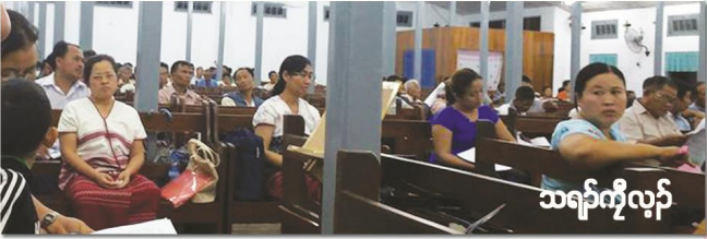
သရဏ်ကူလုာ်